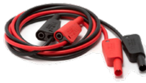
Testkablar Testkablar (svarta och röda) med stapelbar 4 mm bananhankontakt i båda ändrar, kabellängd 1 m (3 fot).