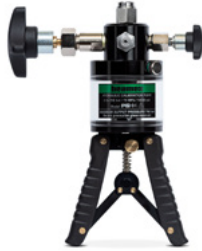
Beamex PGHH kalibreringspump 0 ... 700 bar / 0 ... 10 000 psi