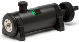
Beamex PGL kalibreringspump -400 ... 400 mbar / -160 ... 160 iwc