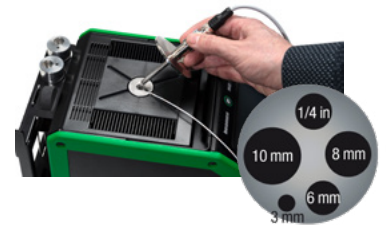
Insatser för MC6-T Utbytbara insatser med hål av olika storlek för att möjliggöra kalibrering av temperaturgivare med olika diameter.