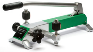
Beamex PGPH kalibreringspump -0,95 ... 140 bar / -13,7 ... 2 000 psi