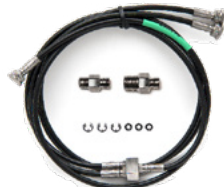
Tryckslangar 40 bar/600 psi tryck sats med T-slang 1,5 m (5 fot) med NPT-kopplingar och tätningar. Slangarna har Bx G1/8" hongänga i alla ändrar.