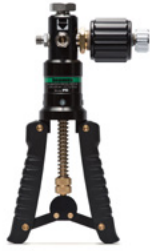
Beamex PGC kalibreringspump -0,95 ... 35 bar / -13,7 ... 510 psi