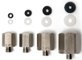
Tryckkopplingar Bx G1/8" hane (för 40 bar slangar), Bx 1215 hane (för 630 bar slangar), satser med tryckkopplingar och rörkopplingar.