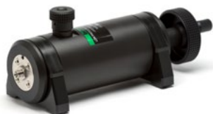
Pompa di taratura Beamex PGL -400 ... 400 mbar/-160 ... 160 iwc