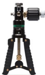
Pompa di taratura Beamex PGC -0,95 ... 35 bar/ -13,7 ... 510 psi