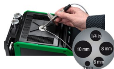
Inserti per MC6-T Inserti intercambiabili con fori di diverse dimensioni, per consentire la taratura di sensori di temperatura con diametri diversi.