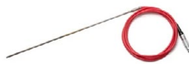
Beamex IPRT Sensore industriale di riferimento Intervallo di temperatura -45 ... 300 °C (-49 ... 572 °F).