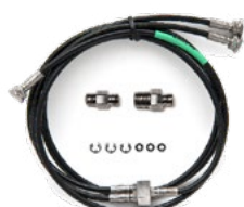
Tubi di pressione Set di tubi flessibili a T per pressione di 40 bar/600 psi da 1,5 m (5 piedi) con raccordi e guarnizioni NPT. I tubi flessibili hanno filettature femmina Bx G1/8" a tutte le estremità.