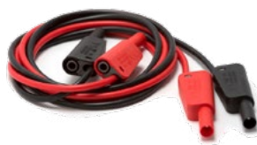
Cavetti di test Cavetti di test (neri e rossi) con spinotto a banana maschio sovrapponibile da 4 mm su entrambe le estremità, lunghezza cavo 1 m (3 piedi).