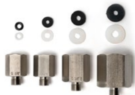
Raccordi di pressione Bx G1/8" maschio (per tubi flessibili da 40 bar), Bx 1215 maschio (per tubi flessibili da 630 bar), set di raccordi di pressione e raccordi per tubi flessibili.