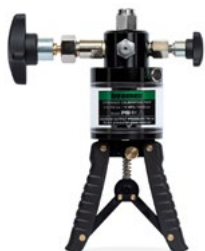
Pompa di taratura Beamex PGHH 0 ... 700 bar/ 0 ... 10.000 psi