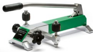
Pompa di taratura Beamex PGPH -0,95 ... 140 bar/-13,7 ... 2.000 psi