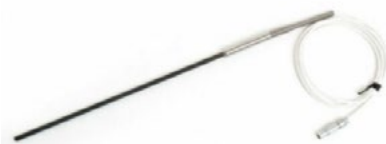
Beamex RPRT Sensore di riferimento ad alta accuratezza Intervallo di temperatura fino a 660 °C (1220 °F).